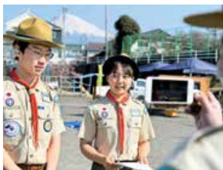
全国こども体験フォーラム／6ページ