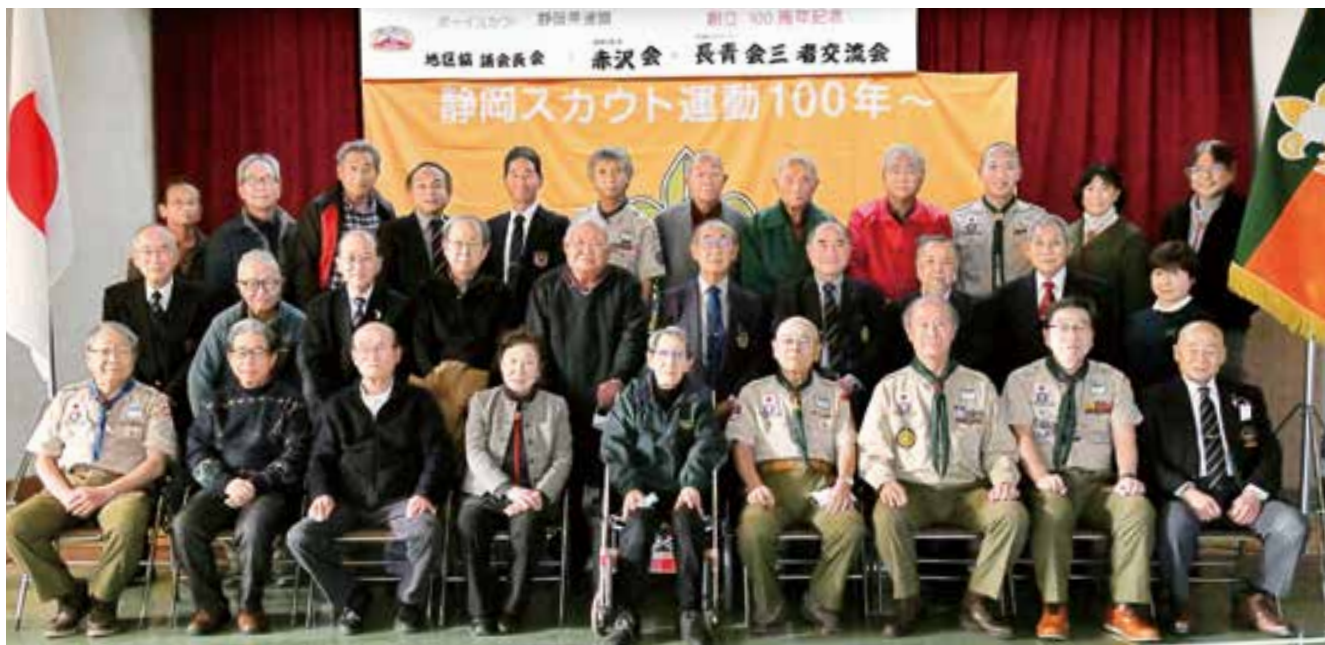
静岡県連盟結成100周年記念《地区協議会会長・静岡赤沢会・長青会》三者交流会／3ページ