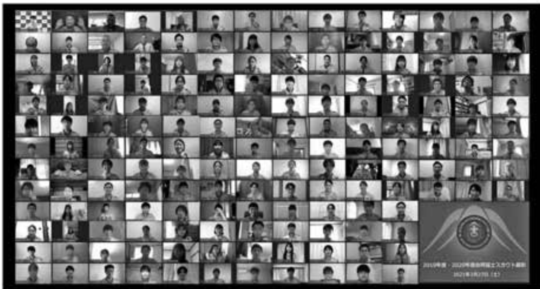
(ボーイスカウト日本連盟HPより転載)

同日午後は、2019年度、2020年度に富士スカウト章を受章したスカウトのうち31県連盟166人が集合しました。菅内閣総理大臣、萩生田文部科学大臣、逢沢衆議院議員(ボーイスカウト振興国会議員連盟会長)、奥島孝康 ボーイスカウト日本連盟総長、宮川大輔 ボーイスカウト アンバサダー(お笑い芸人)からそれぞれ激励メッセージをいただき、その後「25歳のわたしは、世の中に対して何ができるようになっていきたいか?」をテーマに、全国の仲間たちと話し合い・交流の時間を持ちました。