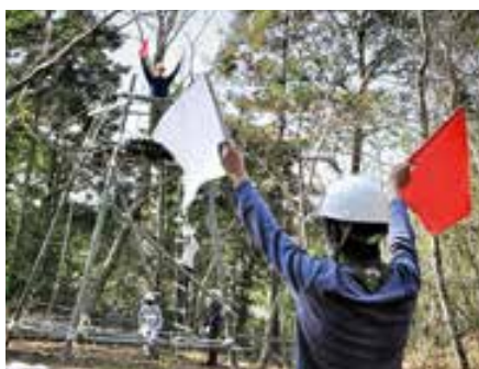
パイオニアリングに挑戦／5ページ