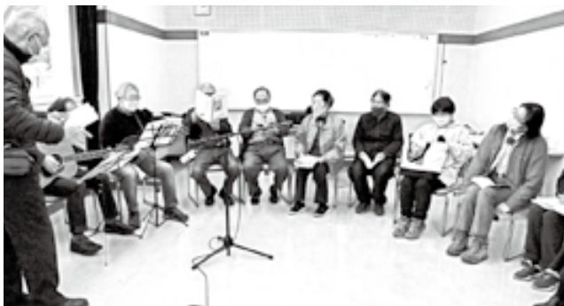
BGM: 赤沢クラブ合唱団