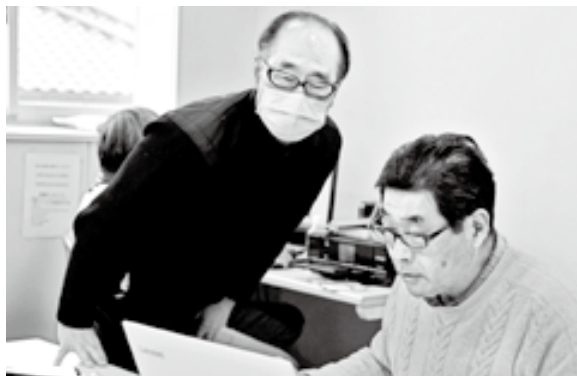
大澤副コミッショナー