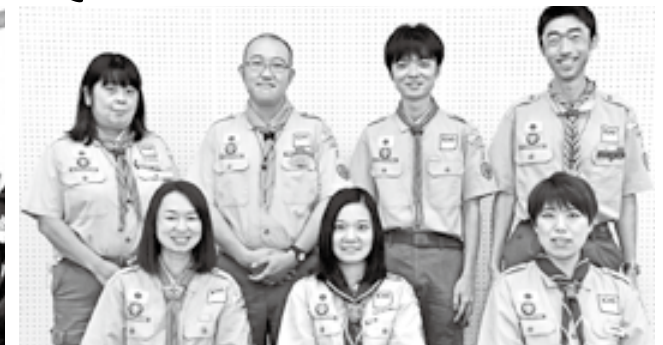
「若き指導者」の皆さん