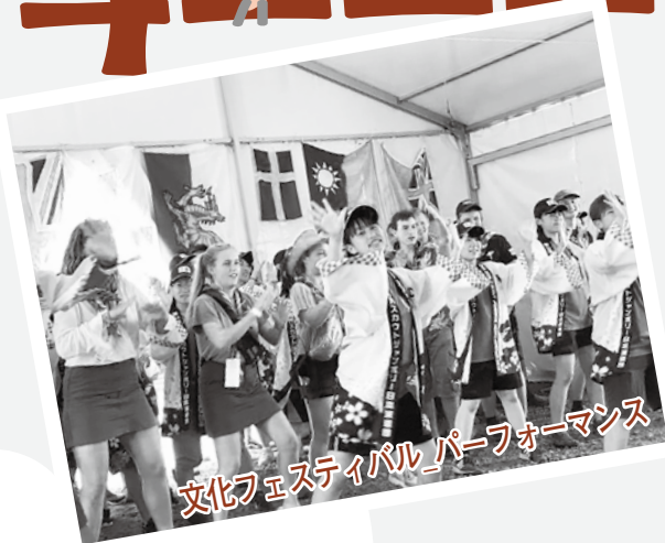
文化フェスティバルパフォーマンス