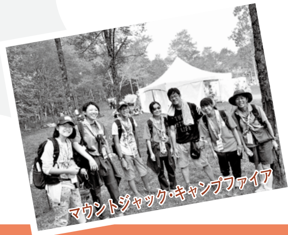
マウントジャック・キャンプファイア

自分は世界ジャンボリーの中で班長を勤めました。今回は自団のスカウトだけでなくいろいろなところから来ているために、統制を取っていくのが非常に難しかったです。その中でよく「パトローリング」という言葉が出て来たのが印象に残っています。班員の個性をどう班の中に生かすかが大事なことだと気付くことができました。