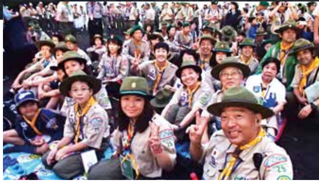
第12回日本アグーナリー