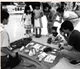
会場は多くの家族つれて賑わいました。

静岡県連盟では、7月9日(土)にイオンモール浜松市野で開催し、320名の方がコーナーを訪れました。活動の様子は、7月10日の静岡新聞でも紹介されています。