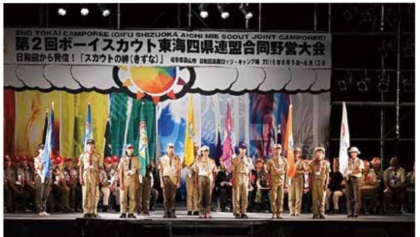
第2回東海4県連盟合同野営大会