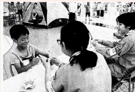
ボーイスカウトからロープの結び方を教わる子ども ＝浜松市東区のイオンモール浜松市野

ボーイスカウトが防災知識や技紹介 東区 日本ボーイスカウト 県連盟(前沢倫理専長 は9日)へ全国防災キ 40人が災害時に役立つ